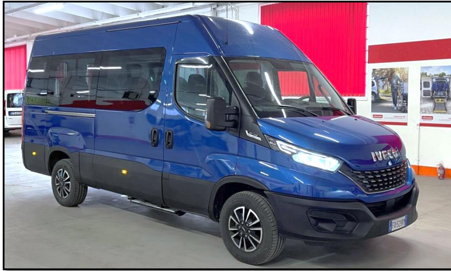
Daily „Combi 9-Sitzer“ 3.0 – Diesel Euro VI/e